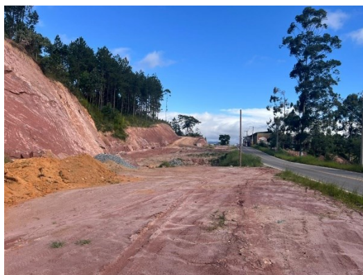
Descrição: Fotografia do fim da pavimentação – Sentido Centro para a BR-267