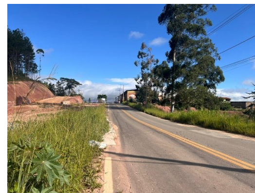
Descrição: Fotografia do fim da pavimentação – Sentido Centro para a BR-267