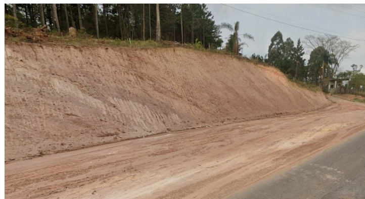
Descrição: Fotografia do meio da pavimentação – Sentido Centro para a BR-267