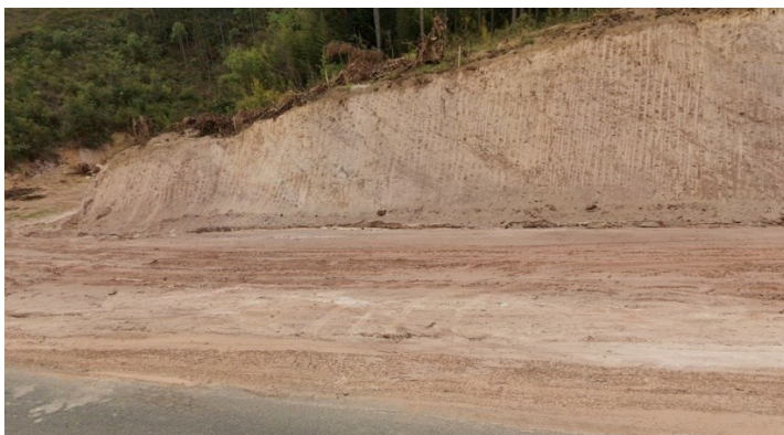
Descrição: Fotografia do meio da pavimentação – Sentido Centro para a BR-267