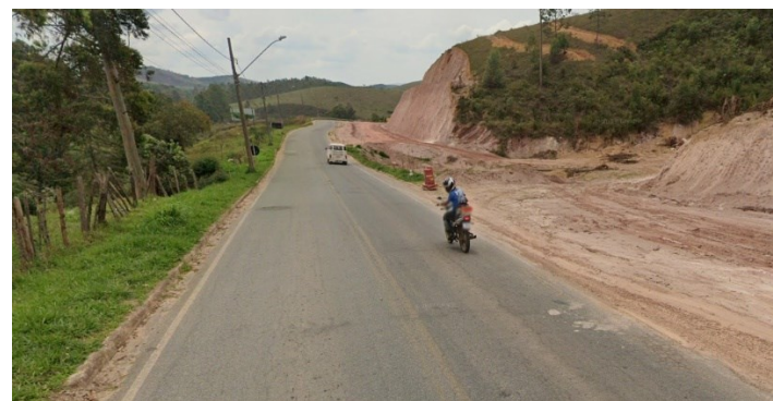
Descrição: Fotografia do meio da pavimentação – Sentido Centro para a BR-267