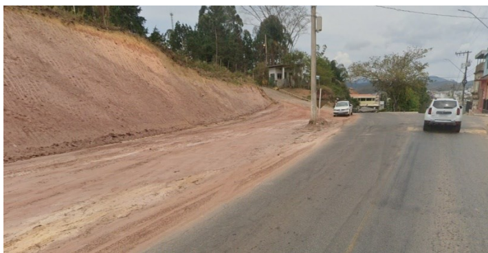
Descrição: Fotografia do meio da pavimentação – Sentido Centro para a BR-267