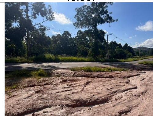
Descrição: Fotografia do fim da pavimentação – Sentido Centro para a BR-267