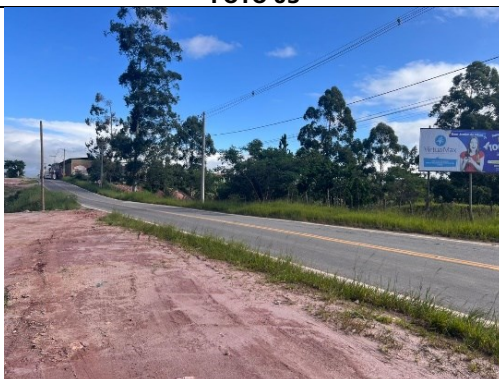
Descrição: Fotografia do fim da pavimentação – Sentido Centro para a BR-267